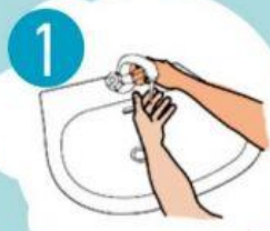
1 RANKAS SUDRĖKINTI VANDENIU