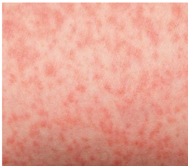
2 pav. Bėrimas būdingas skarlatinai [13] 3 pav. Avietinis liežuvis [13]

Skarlatinės inkubacinis periodas – 1–6 d. (dažniausiai 2–3 d.) [4]. Liga prasideda nespecifiniais simptomais – gerklės skausmu, karščiavimu, galvos skausmais, pykinimu, vėmimu. Po 12–48 val. išsivysto specifiškas, generalizuotas, eriteminis bėrimas (2 pav.), kuris dažnai prasideda krūtinės srityje ir greitai išplinta po kūną apimdamas galūnes. Bėrimas dažnai ryškesnis odos raukšlėse (lenkimo raukšlėse), esančiose kaklo, kirkšnių, pažastų, alkūnių, kelių srityje. Šios sritys yra vadinamos Pastijos linijomis ( angl. Pastia's lines ). Bėrimas primena švitrinio popieriaus tekstūrą. Asmenims, sergantiems skarlatina, būdingas paraudęs veidas, išskyrus sritį aplink burną. Sritis aplink burną būna blyški. Kiti skarlatinės simptomai: tonzilofaringitas, padidėję kaklo limfmazgiai, smulkios raudonos dėmelės ant gomurio (petechijos) ir avietinis liežuvis (3 pav.), kuris ligos pradžioje būna pasidengęs baltu apnašu (baltai avietinis liežuvis).