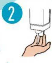
2 UŽPILTI MUILO, KAD PADENGŲ VISUS PAVIRŠIUS