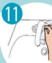
11 ČIAUPĄ UŽDARYTI NAUDOJANT VIENKARTINĮ RANKŠLUOSTĮ