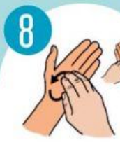
8 SUKAMAISIAIS JUDESIAIS TRINTI KIEKVIENOS RANKOS DELNĄ