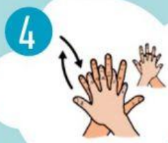
4 DEŠINIOSIOS RANKOS DELNU TRINTI KAIRIOSIOS PLAŠTAKOS VIRŠŲ IR ATVIRKŠČIAI