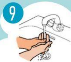
9 RANKAS PLAUTI VANDENIU