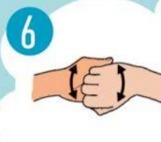
6 KIEKVIENOS RANKOS DELNU TRINTI KITOS RANKOS PIRŠTUS