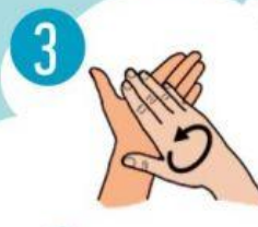
3 DELNĄ TRINTI Į DELNĄ