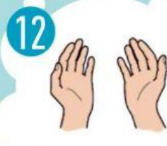
12 RANKOS SAUGIOS