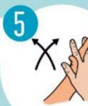
5 SUGLAUSTI DELNUS, SUPINTI PIRŠTUS IR TRINTI