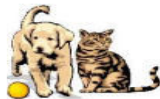
JŲ SU GYVŪNŲ IŠMATOMIS PATENKA Į ŽEMĘ, ANT VAISIŲ, DARŽOVIŲ