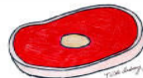
JOS APSIGYVENA RAUMENYSE