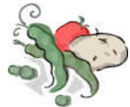
JŲ PATENKA Į DIRVOŽEMĮ, VANDENĮ, ANT DARŽOVIŲ