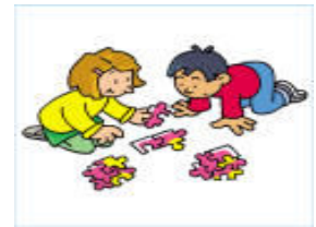
JŲ PATENKA ANT RANKŲ, ŽAISLŲ, KITŲ DAIKTŲ